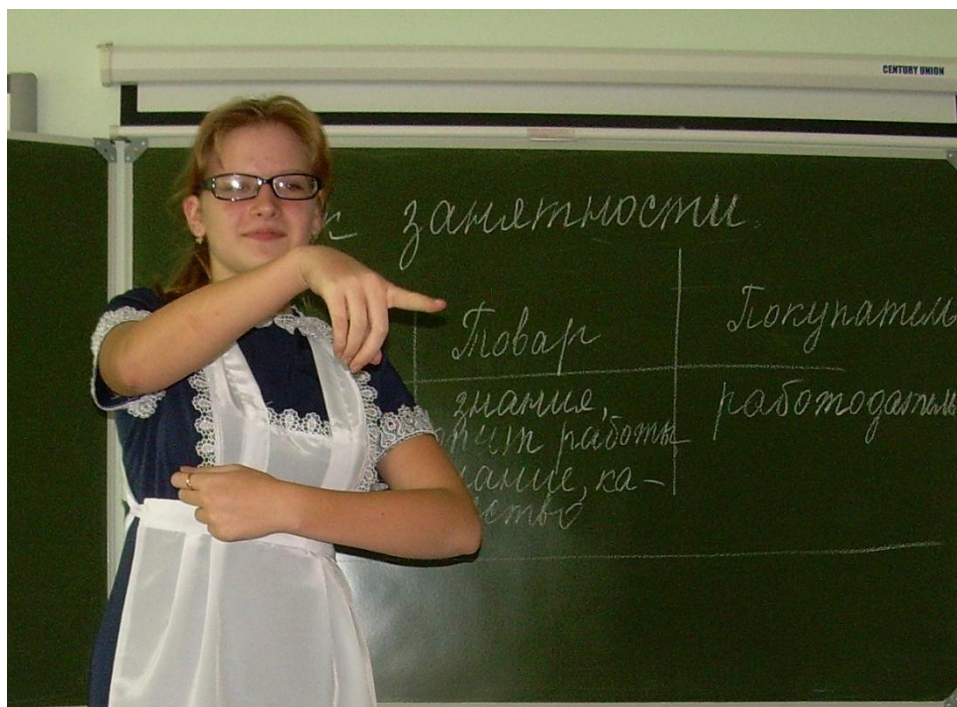
Игра «Узнай профессию по жестам» (аналог игры «Поступь профессионала»).